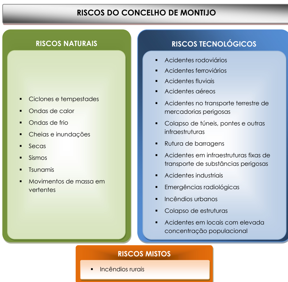
Figura 2. Riscos de origem natural, tecnológica e mista que podem afetar o concelho de Montijo

Neste sentido, de acordo com a caracterização do território municipal e a análise de riscos detalhadas no Anexo II, identificam-se na Figura 2 os riscos naturais, tecnológicos e mistos que, potencialmente, poderão ocorrer no concelho de Montijo.