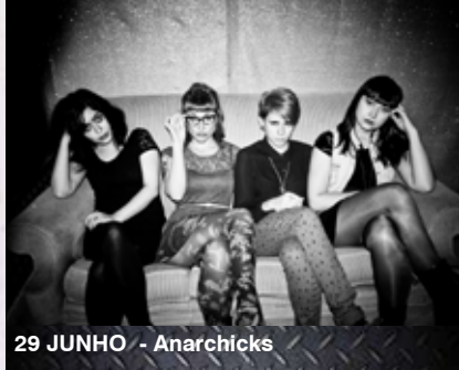
29 JUNHO - Anarchicks