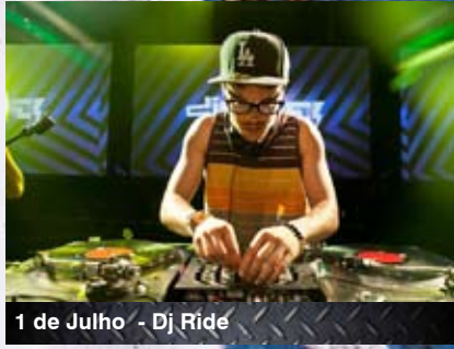
1 de Julho - Dj Ride