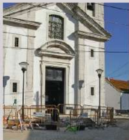
Escavação arqueológica no Largo da Igreja, Sarilhos Grandes, 2008

Desde então, a equipa multidisciplinar do projeto Sarilhos Grandes, através da recolha de amostras, tem realizado estudos com o objetivo de obter informações acerca da dieta e das doenças da população de Sarilhos Grandes.