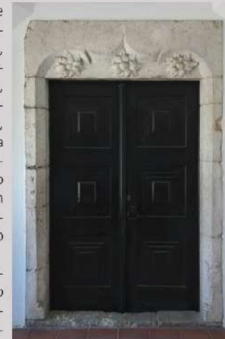
Portal manuelino da Ermida de Nossa Senhora da Piedade, Sarilhos Grandes.

A nova intervenção arqueológica terá também como objetivo identificar contextos associados à construção da Igreja de São Jorge e da Ermida de Nossa Senhora da Piedade.