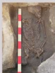
Exemplo de indivíduo do sexo feminino enterrado de acordo com o ritual cristão.

Os dados alcançados até 2018 permitiram dar a conhecer uma amostra de população ribeirinha cujas investigações levaram à identificação alguns parasitas relacionados com a ingestão de carnes e de águas contaminadas, o consumo de batata, centeio/trigo, feijão ou grão-de-bico entre outros vegetais, bem como de crustáceos. Al-