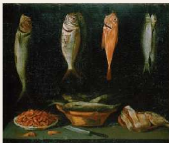
Estudar os hábitos alimentares da população de Sarilhos Grandes é um dos objectivos do projecto. Natureza-morta com peixes e camarões, s/a, século XVII (MNNA).

Estão planeadas duas escavações arqueológicas e antropológicas, uma no interior da Ermida de Nossa Senhora da Piedade (panteão dos Cotrim) e outra no exterior da Igreja de S. Jorge, com a intenção de recolher novos dados bio-arqueológicos. As